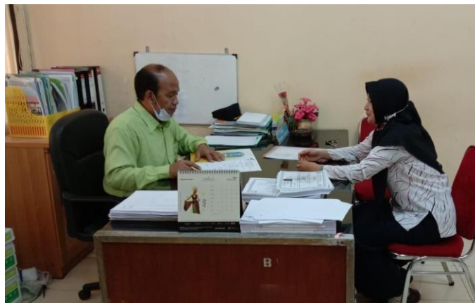
Gambar 5. 1 Dokumentasi Wawancara dari informan KKI / Instruktur di UPT BLK JOMBANG.