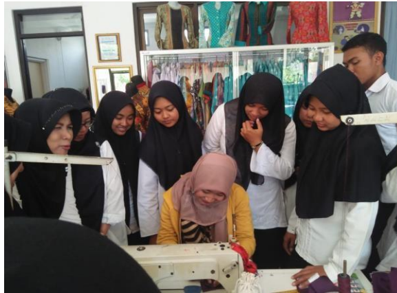
Gambar 5. 5 Workshop Pelatihan kejuruan Garment Apparel ( pembuatan lubang kancing ).