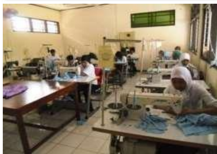
Gambar 5. 4 Workshop Pelatihan Menjahit kejuruan garment apparel di UPT BLK Jombang.