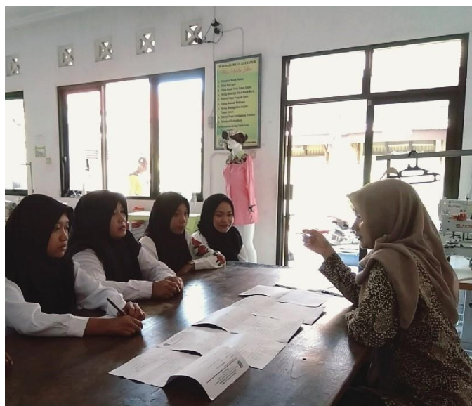
Gambar 5. 3 Dokumentasi wawancara dari informan Peserta Didik kejuruan Garment Apparel di UPT BLK JOMBANG