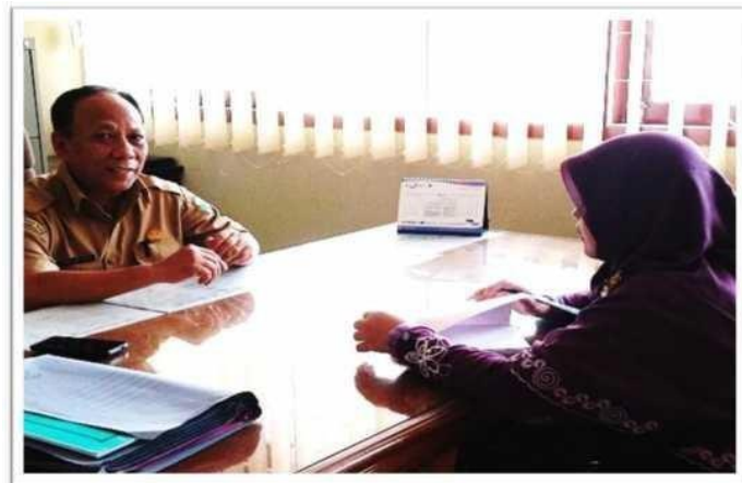
Gambar 5. 2 Dokumentasi Wawancara dari informan KKI / Instruktur di UPT BLK JOMBANG