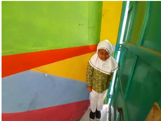
Anak bersembunyi agar tidak ditemukan penjaga atau benteng di tempat yang aman