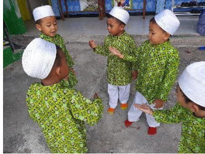
Foto anak melakukan Hompimpah dengan tanpa bantuan orang lain