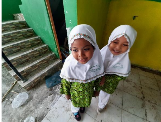
Anak sebagai penjaga menangkap anak yang bersembunyi