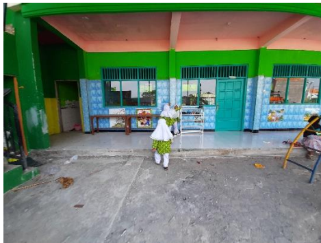
Anak tertangkap namun berhasil berlari dan menyentuh benteng