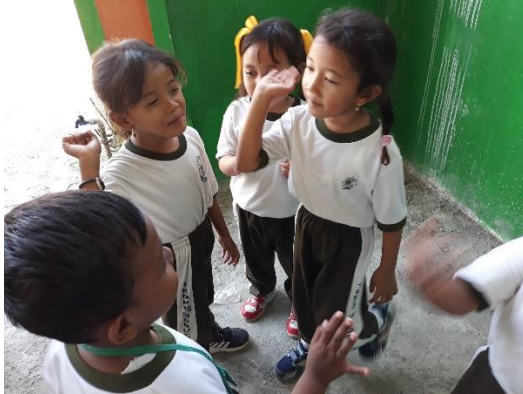
Foto anak melakukan Hompimpah tapi ada anak yang masih berdiri hanya memperhatikan temannya