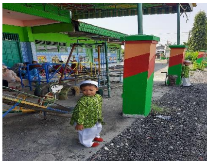
Anak bersembunyi dan benteng mencari anak yang bersembunyi