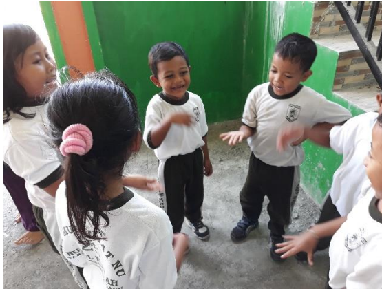
Anak melakukan Hompimpah dengan baik dan benar