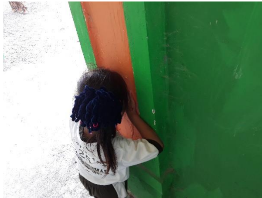
Anak menjadi benteng dan bertugas menghitung 1-10 saat teman bersembunyi kemudian nanti setelah hitungannya selesai akan mencari temannya yang bersembunyi