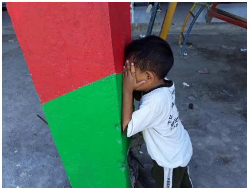
Anak bertugas menjadi benteng dan menjaga benteng sambil menghitung 1-10