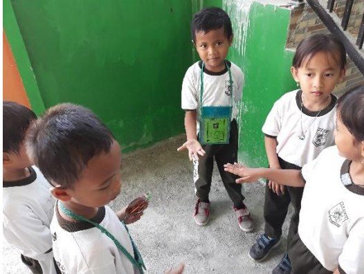
Anak melakukan Hompimpah secara bersamaan