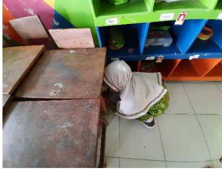
Anak bersembunyi agar tidak ditemukan penjaga