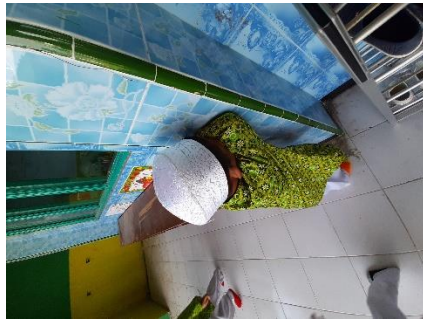
Anak menjaga benteng dan mengitung 1-10 sembari temannya bersembunyi