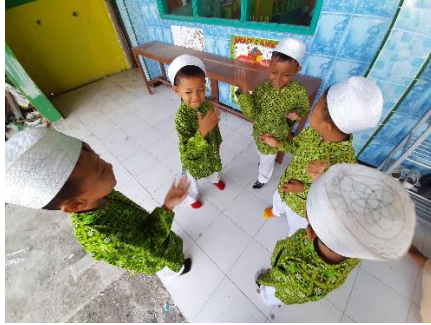
Anak melakukan Hompih dengan baik dan benar