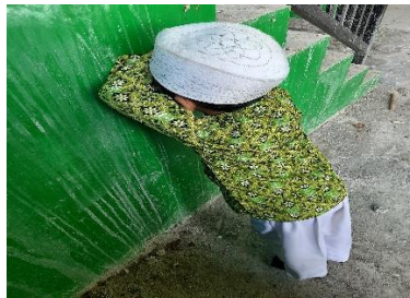
Foto anak menjadi benteng dan mengitung 1-10 dan anak lainnya mencari tempat bersembunyi