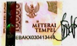
Indri Novia Larasati