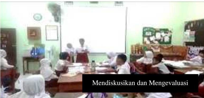
Mendiskusikan dan Mengevaluasi