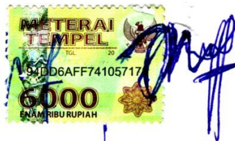
Nanda Indri Yunaini

Surabaya, 11 Januari 2019 Yang membuat pernyataan,