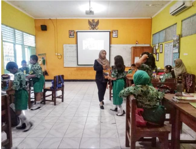
Penyerahan skenario dan peralatan untuk bermain peran