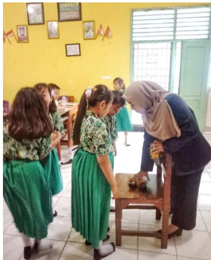
Pengambilan undian skenario perwakilan setiap kelompok