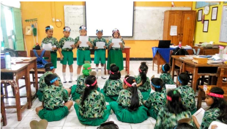
Peserta didik secara bergantian tampil sesuai dengan skenario kelompok