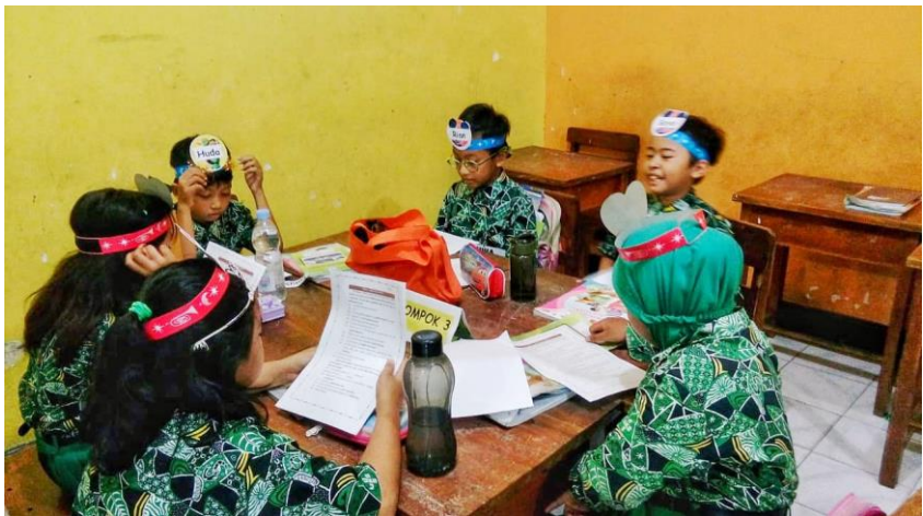
Peserta didik mempelajari skenario yang telah di dapat