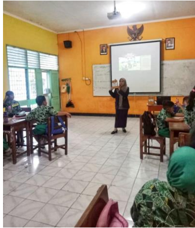
Guru memberi pengarahan cara bermain peran