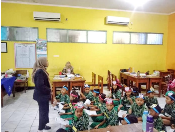
Guru memberi pengarahan kepada peserta didik sebelum mereka tampil