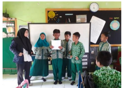
Mempresentasikan tugas kelompok