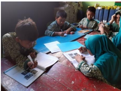
Mengerjakan tugas kelompok