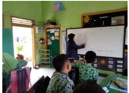
Menyimak penjelasan dipapan tulis