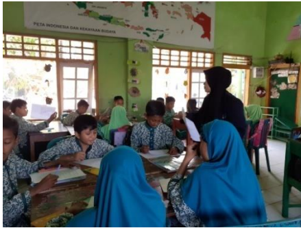
Saat mengerjakan pretest