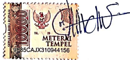
(Novita Dwi Wulandari)