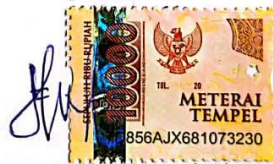
Sinta Imroatul Khusniya