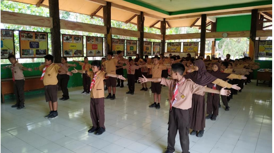
Kegiatan Kepramukaan PKS (Patroli Keamanan Sekolah)