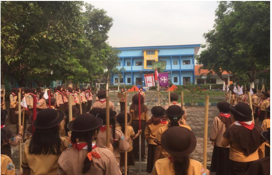
Penerapan Kegiatan PBB dalam Upacara Bendera