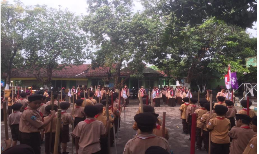
Pelaksanaan Kegiatan Persami