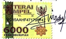
Windy Dwi Lorendha

Surabaya, 24 Januari 2020 Yang membuat pernyataan,