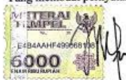
Fitri Widya Wailandini

Surabaya, 14 Januari 2020 Yang membuat pernyataan,