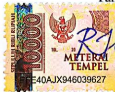
Erike Agis Stiawati

Surabaya, 28 Januari 2022 Yang membuat pernyataan,