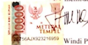
Windi Puji Lestari

Surabaya, 24 Januari 2022 Yang membuat pernyataan,