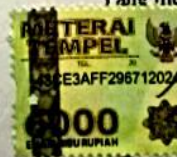
Revita Putri Cahyani

Surabaya, 31 Januari 2019 Yang membuat pernyataan,