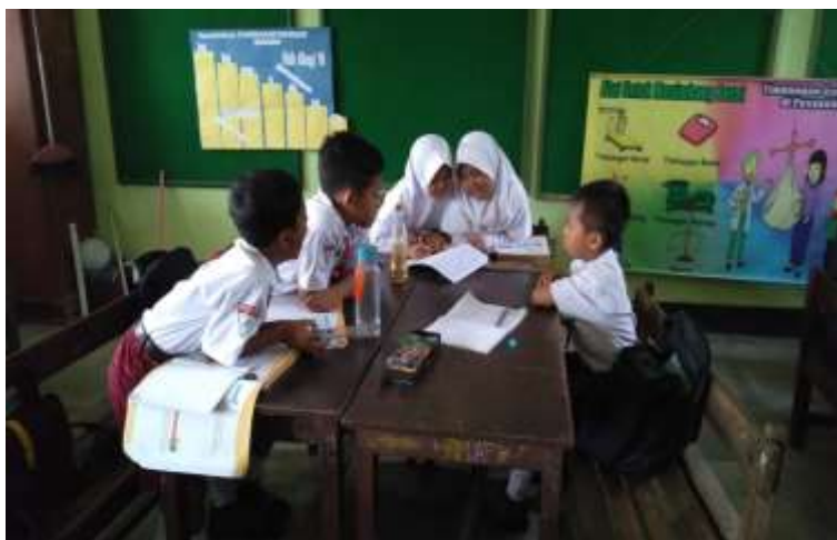
Satu kelompok awal berjumlah 4-5 siswa