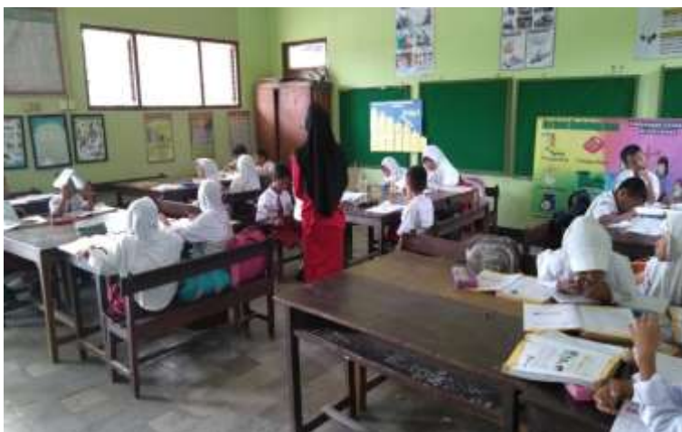
Kelompok awal dengan jumlah siswa 4-5 siswa