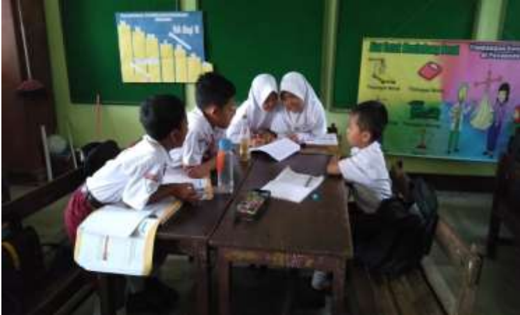
Setelah berdiskusi dengan kelompok ahli, siswa kembali ke kelompok awal masing-masing