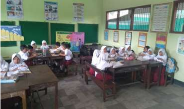
Kelompok ahli dengan kelompok yang berbeda mendiskusikan materi yang sama