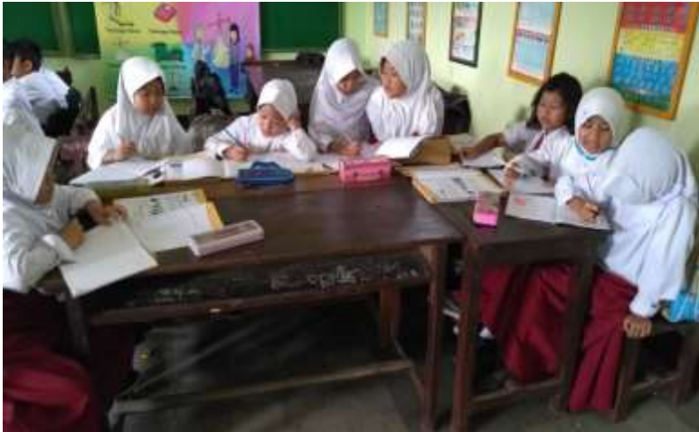
kelompok ahli mendiskusikan materi yang diperoleh