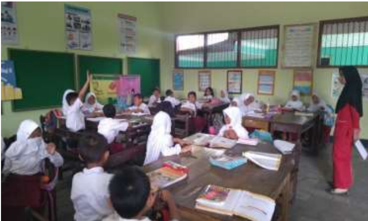
Tiap tim ahli mempresentasikan hasil dikusi