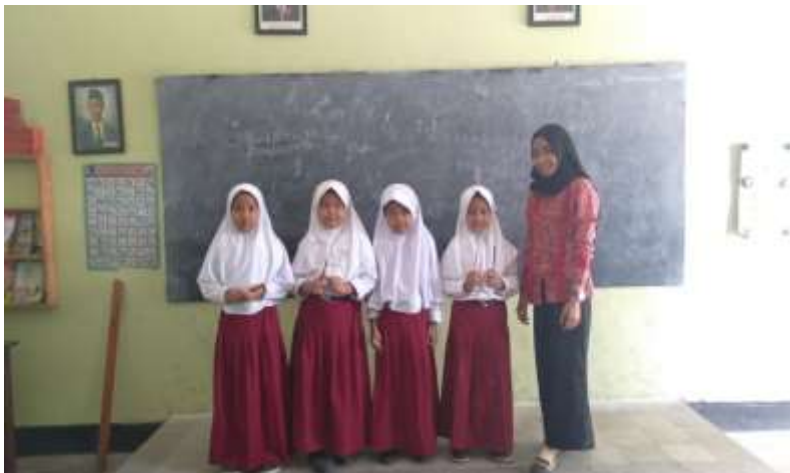
Guru memberi penghargaan kepada kelompok yang mendapat nilai tertinggi