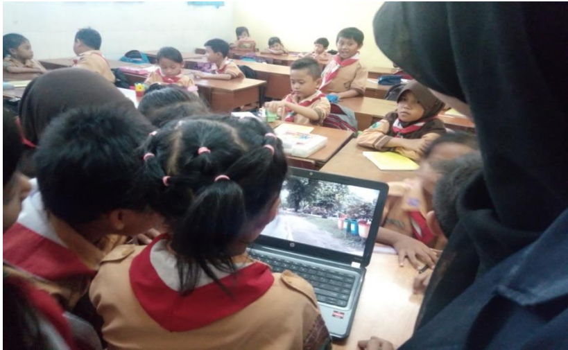
Siswa Bermain Tebak Kata yang ada di Tema 4 Kelas Eksperimen