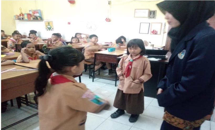
Siswa Mengerjakan Angket Media Kelas Eksperimen