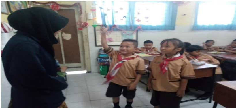
Siswa Bermain Tebak Kata Kelas Kontrol