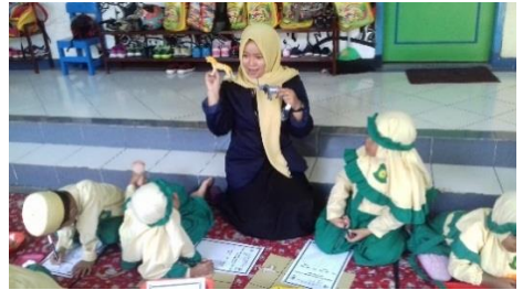
Gambar 2. Peneliti Sedang Memberikan Penjelasan dan Cara Main Pada Anak