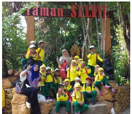
Gambar 4. Kegiatan Puncak Tema Binatang Makhluk Ciptaan Allah