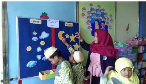
Gambar 3. Peneliti Sedang Membantu Anak Yang Sedang Kesulitan