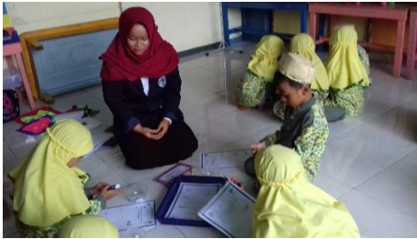
Gambar 1. Peneliti Sedang Mengamati Kegiatan Anak