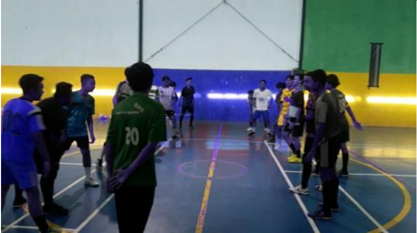
Pertemuan 2 (pemberian perlakuan pertama)