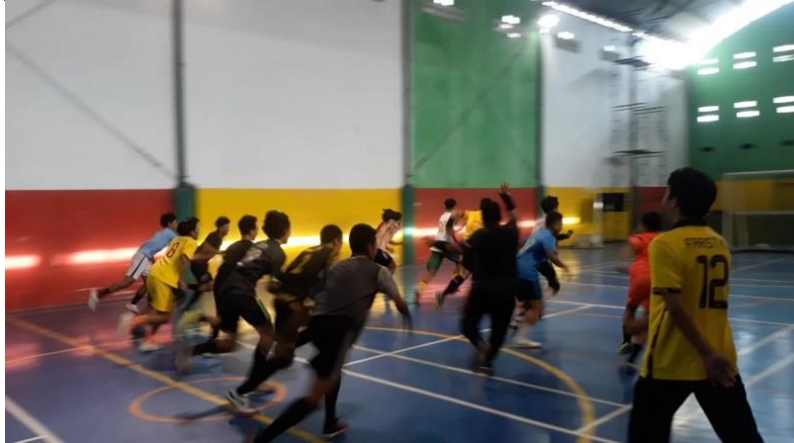
Pertemuan 3 (pemberian perlakuan kedua)