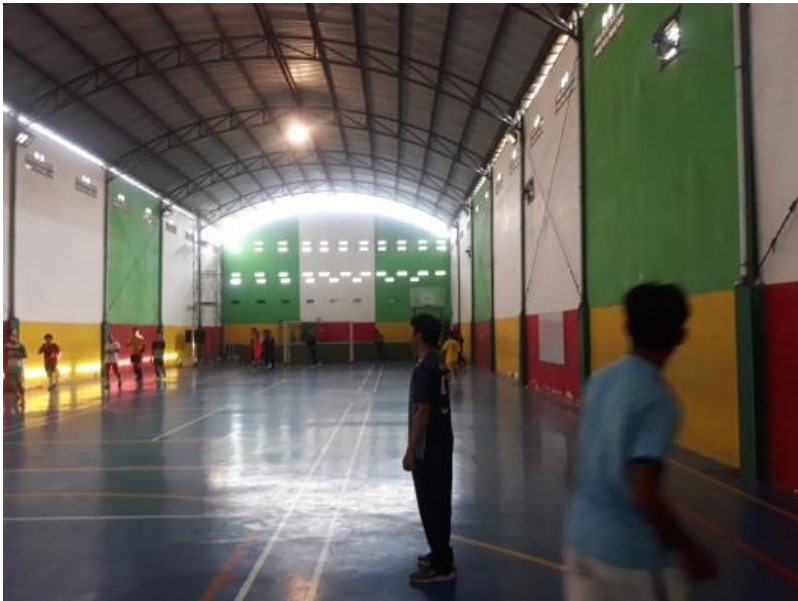
Pertemuan 1 (pemanasan sebelum diberikan perlakuan)