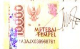
Yoga Galih Prakoso