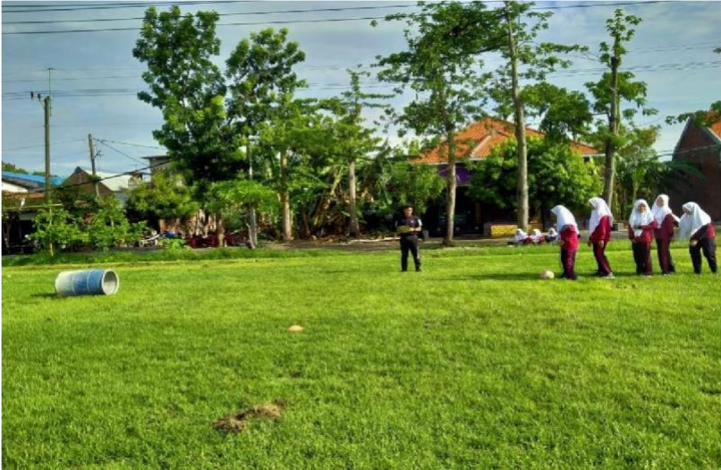
Foto bersama siswa kelas VIII SMP Diponegoro Driyorejo