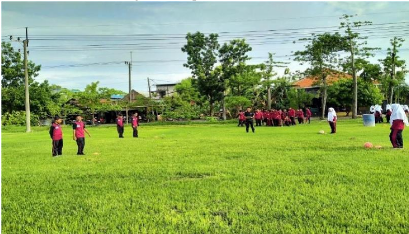
Variasi latihan passing