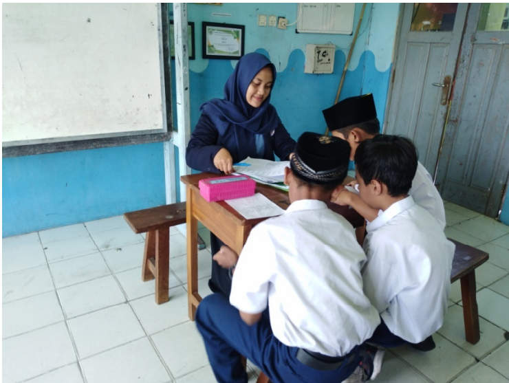
Teacher gave the treatment by using Image Association Technique in Control class