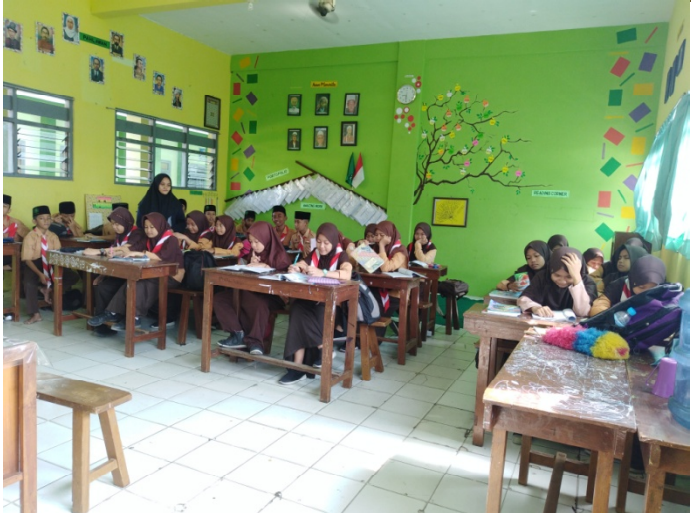
Pre-Test VII B (Experiment Class)