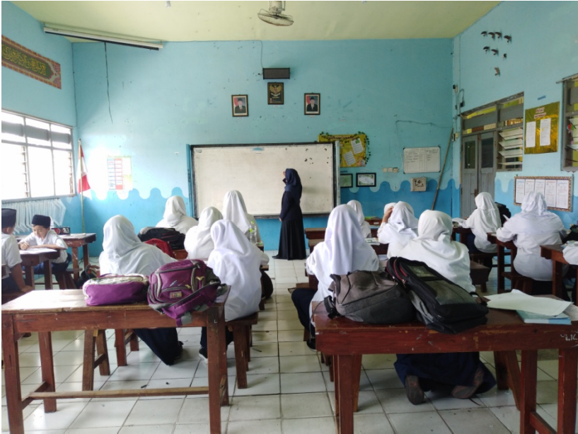
Pre-test VII-C (Control Class)