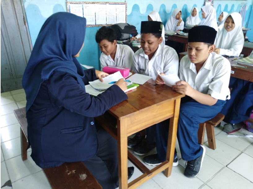
Post-test VII-C (Control Class)