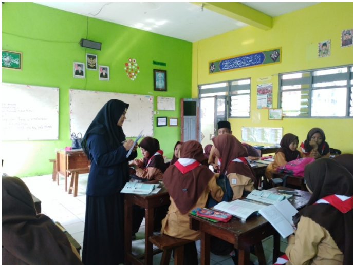
Post-test VII-B (Experiment Class)