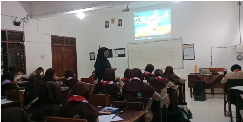
Picture 6 Post-Test in Experimental Class