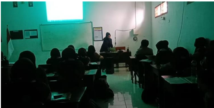
Picture 2 Pre-Test in Experimental Class