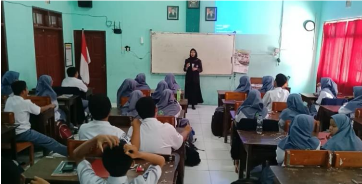
Picture 1 Pre-Test in Control Class