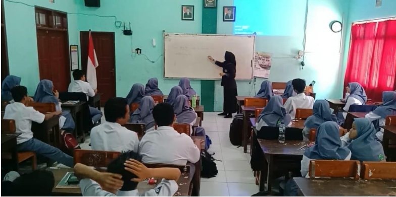
Picture 5 Post-Test in Control Class