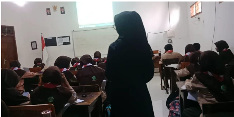
Picture 4 Treatment in Experimental Class