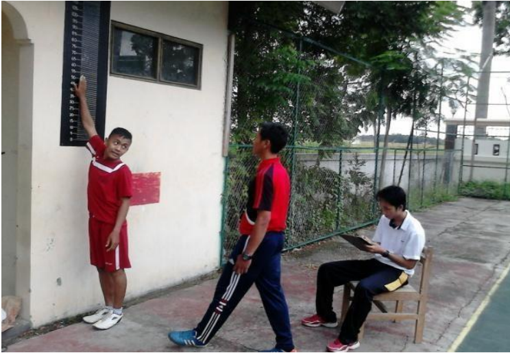
Gambar 1.1 Pretest Vertical jump