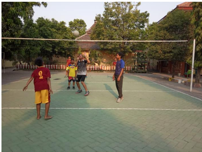
Gambar 2 Siswa melakukan passing dengan melampaui net