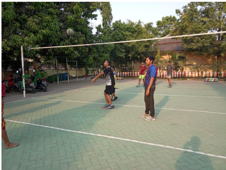
Gambar 1 Siswa melakukan passing