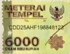
(Dwiki Setyo Widodo)