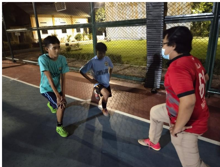
Pemberian treatment half squat