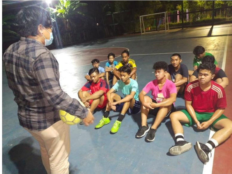
Peneliti sedang briefing kepada sampel