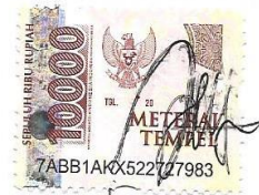
Ayu Lestari NIM.215709