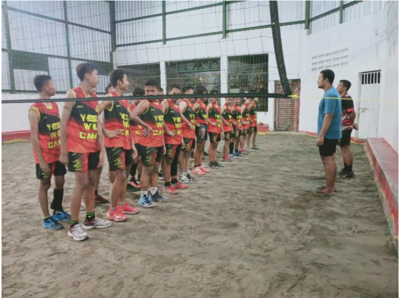
Pengambilan Data Pretest