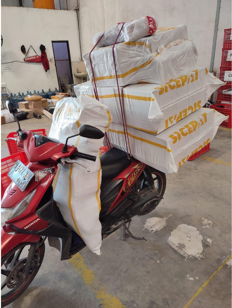
Lampiran 1 Barang Konsumen Siap Antar