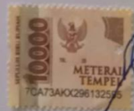
Eufamia Triseku Ralo