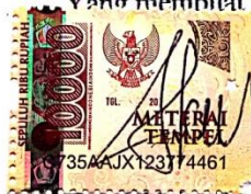
Zammi Mochammad Noer