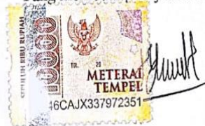
Yudha Dwi Pramono

Surabaya, 15 Februari 2021 Yang membuat pernyataan ini,