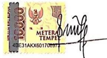
Tarisa Dwi Puspita Ningrum