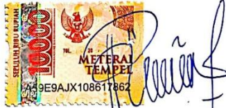
Rinda Dwi Yanti

Surabaya, 09 Februari 2021 Yang membuat pernyataan