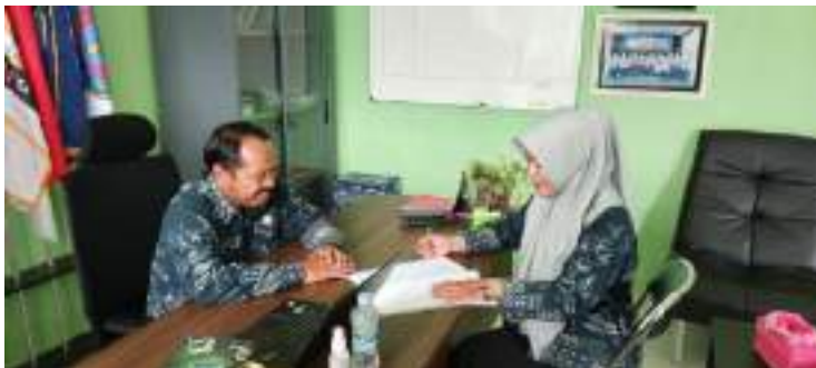
Lampiran 6: Dokumentasi wawancara kepala sekolah UPT SMP Negeri 33 Gresik