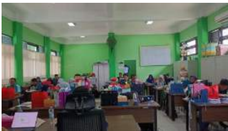
Lampiran 11: Rapat pembentukan RKAS sekolah