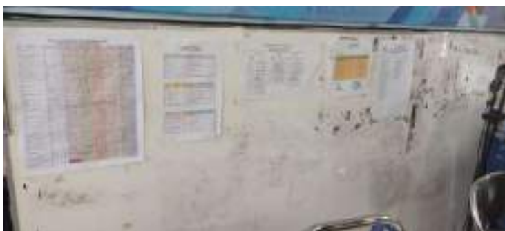
Lampiran 9: Papan Informasi saat rapat