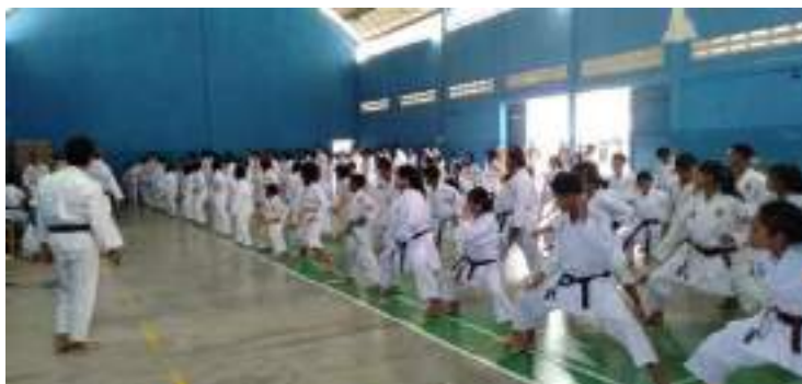
Lampiran 10 :Dokumentasi Kegiatan salah satu extra di UPT SMPN 33 GRESIK