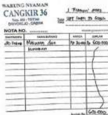
Lampiran 4: Kwitansi dan nota