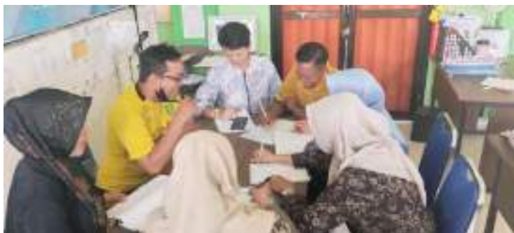
Lampiran 8: Dokumentasi wawancara kepada beberapa guru