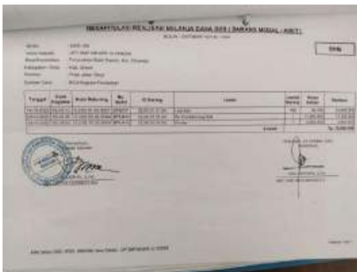
Lampiran 3: CONTOH LAPORAN BUKU KAS UPT SMP Negeri 33 Gresik