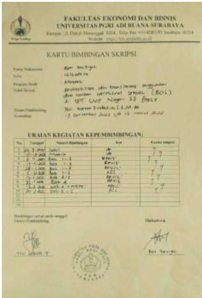
Lampiran 1: Berita Acara Bimbingan Skripsi