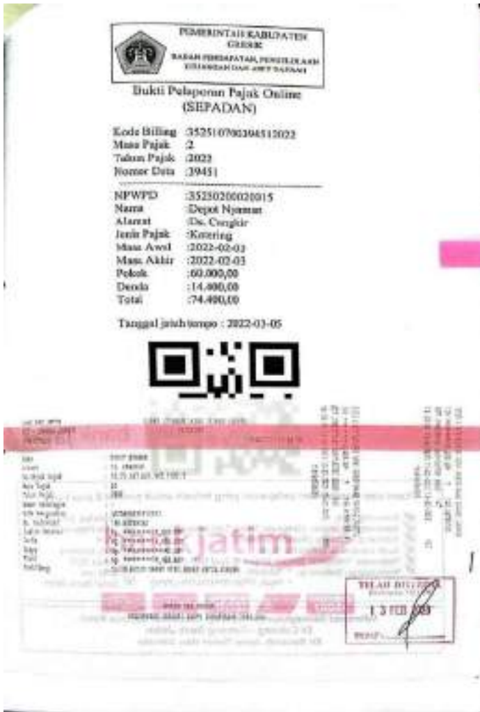
Lampiran 5: Contoh bukti laporan Pajak di UPT SMP Negeri 33 Gresik