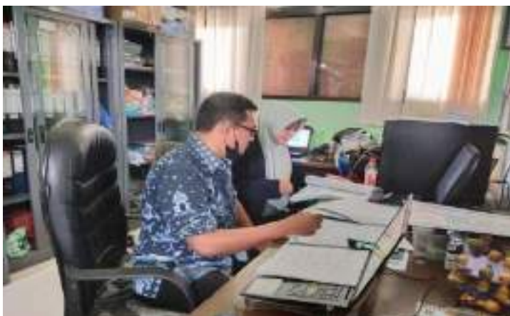
Lampiran 7 :Dokumentasi wawancara Bendahara Upt Smp Negeri 33 Gresik