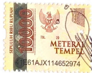
Hajar Nur Ika

Surabaya, 09 Februari 2021 Yang membuat pernyataan,