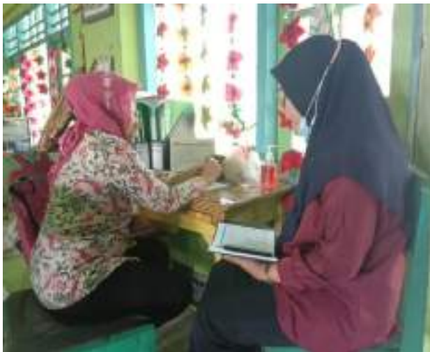
Wawancara dengan guru kelas II SDN Kebondalem