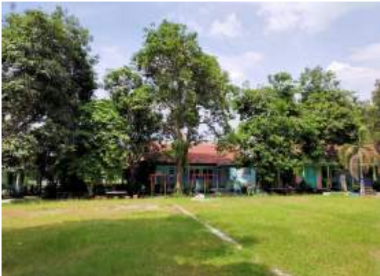
Kondisi SDN Kebondalem