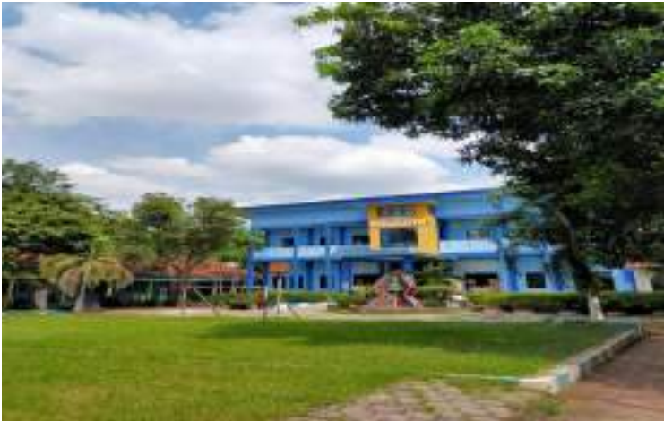
Kondisi SDN Kebondalem