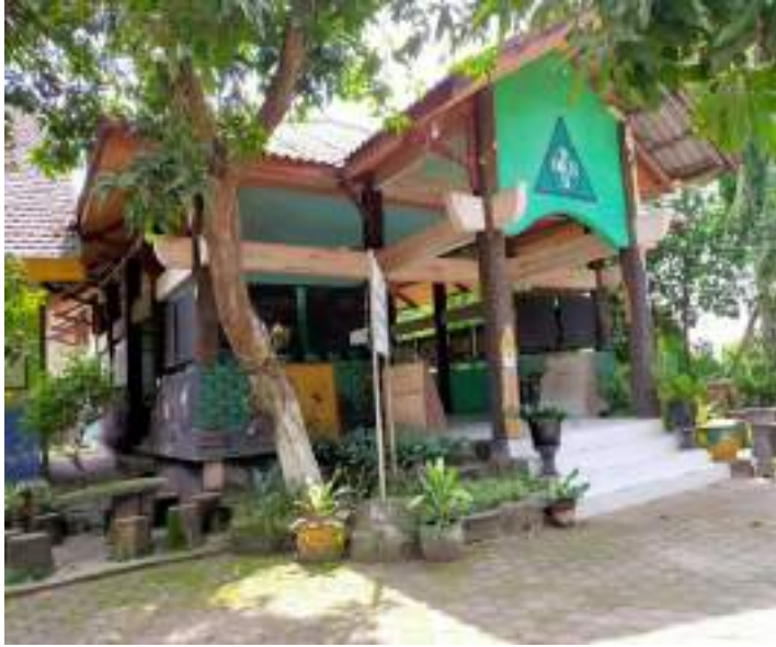
Kondisi SDN Kebondalem