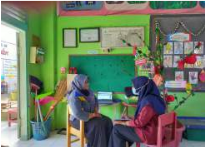
Wawancara dengan Kepala SDN Kebondalem