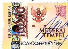
Kukuh Budi Prasetyo