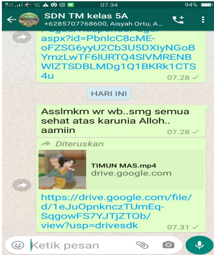
Lampiran 13 Hasil Menyimak dan Tugas