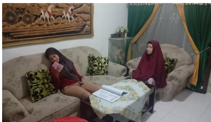
Siswi ( NA) saat mengikuti pelajaran melalui zoom kurang fokus