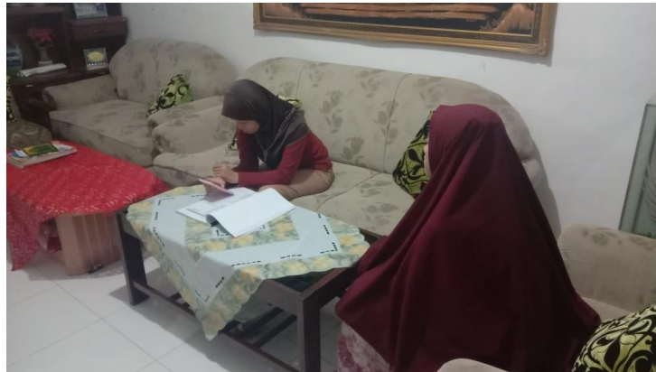
Siswi ( NA) saat mengikuti pelajaran buka tik-tok