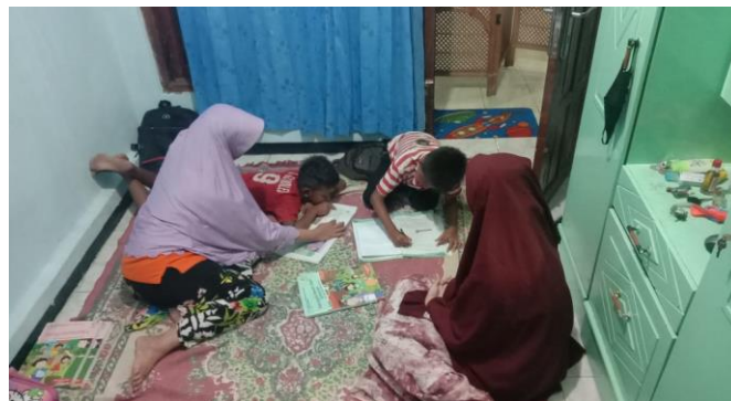
Siswa (MI) ketika belajar bermalas-malasan dan tidak serius dalam belajar