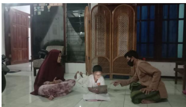
Siswa (GP) belajar sambil main tablet