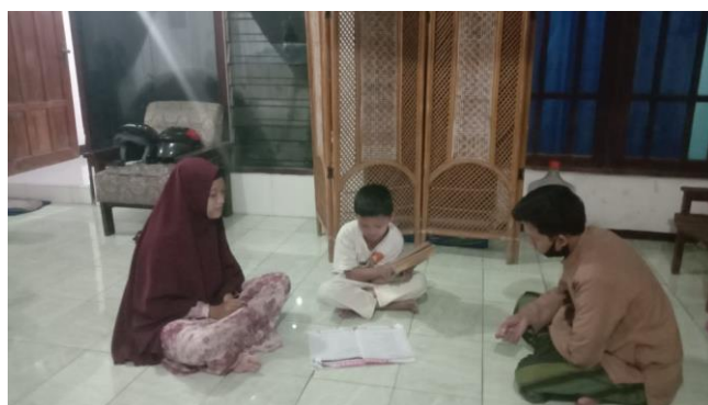
Siswa (GP) belajar kurang serius