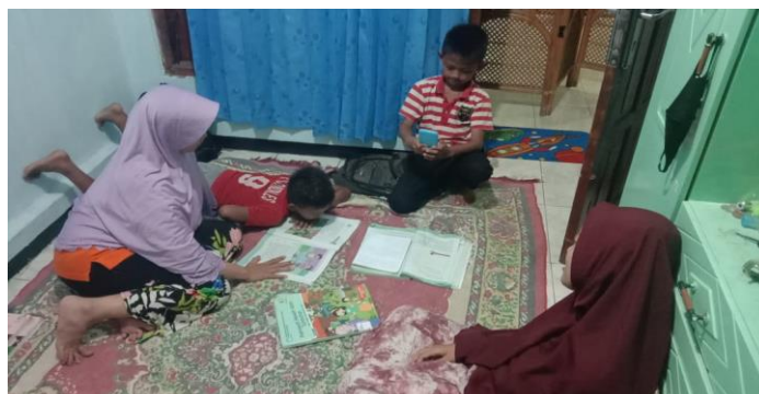
Siswa (MI) ketika belajar bermain HP