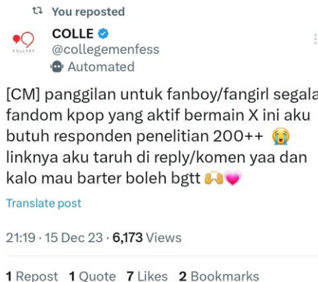
Gambar 2. Proses Mengumpulkan responden hari ketiga