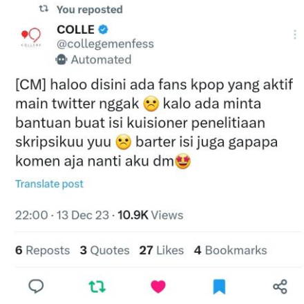
Gambar 1. Proses Mengumpulkan responden hari pertama