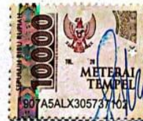
(Sofia Eka Prastiwi)