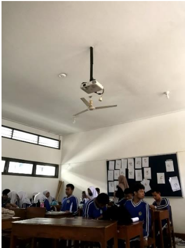
Gambar 2.1 Penyampaian materi batik tulis