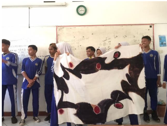
Gambar 2.5 Presentasi Hasil Jadi Batik tulis