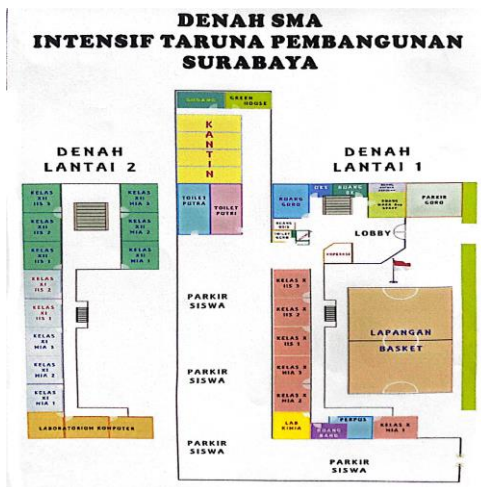
Gambar 1.2 Gambar denah sekolah SMA ITP