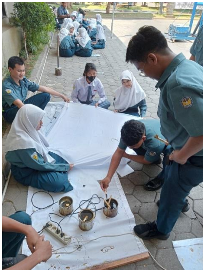
Gambar 2.3 Proses mencanting kain batik (Dok.Pribadi,2023)