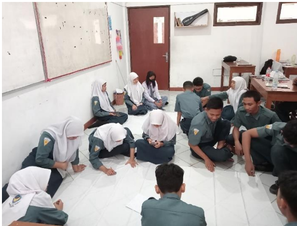
Gambar 2.2 Tahap menggambar sketsa di kain batik (Dok.Pribadi,2023)