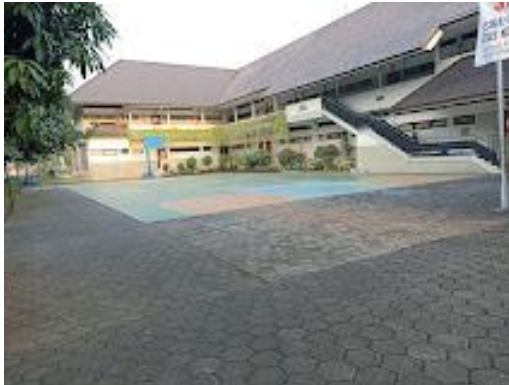
Gambar 1.1 Gambar sekolah SMA ITP