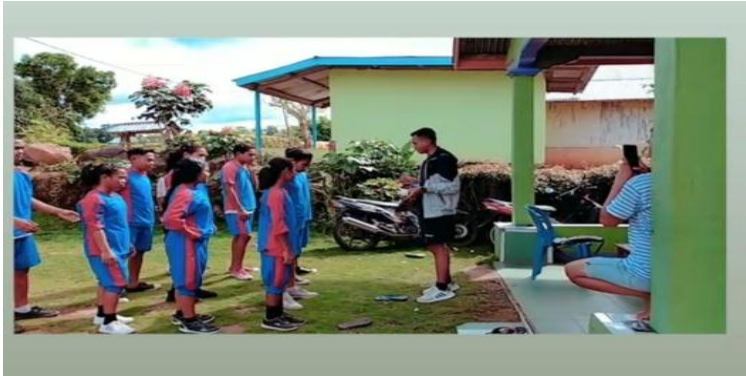
Penjelasan materi backhand