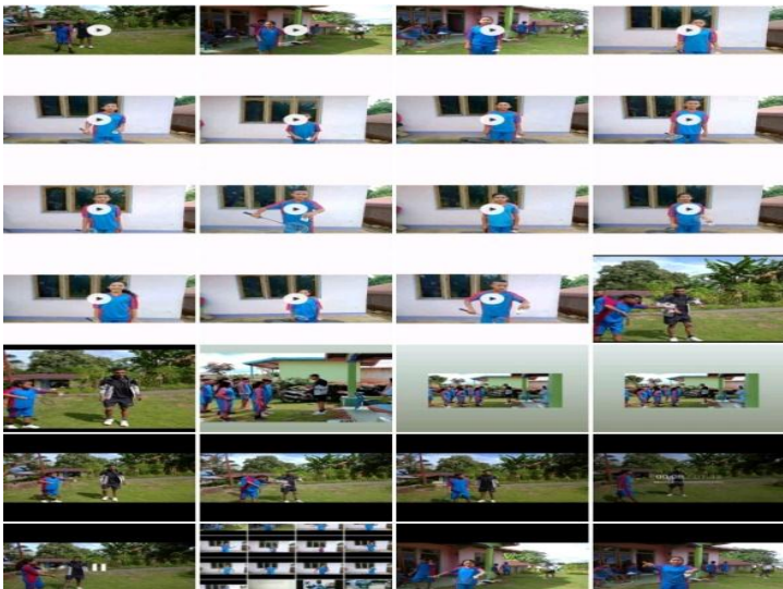
hasil scrishoot praktek servis backhand dengan menggunakan media whatcaap