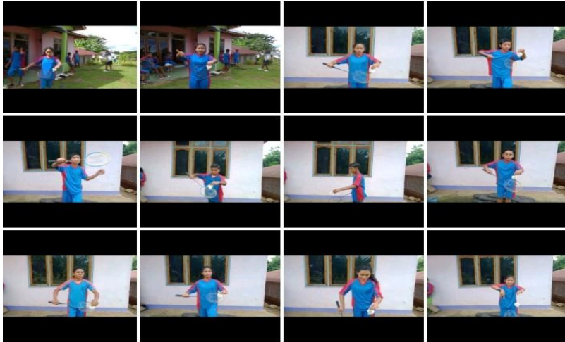
Praktek servis backhand