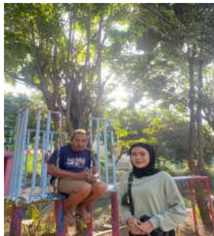
Dokumentasi Wawancara dengan pengeola RTH wilayah Surabaya Timur