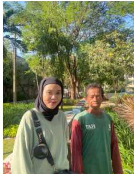
Dokumentasi Wawancara dengan pengelola RTH wilayah Surabaya Timur