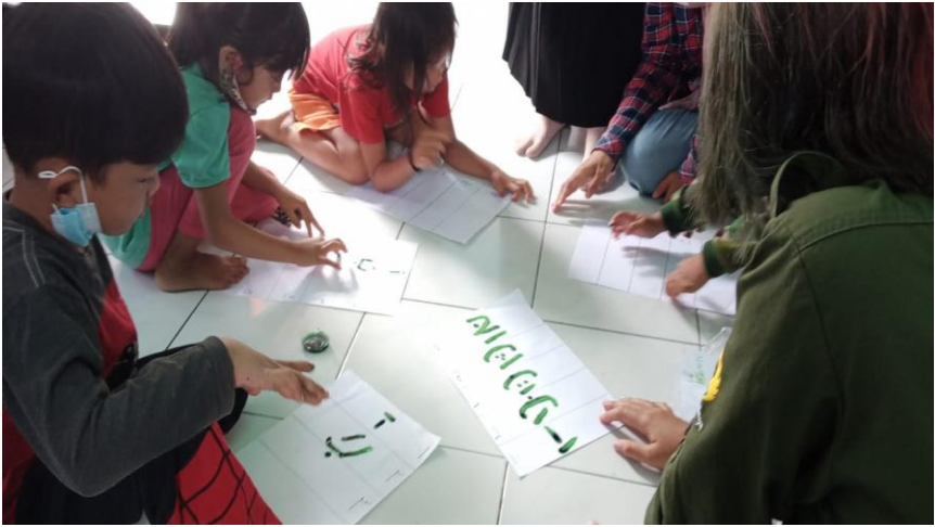
FOTO KEGIATAN PRE-TEST