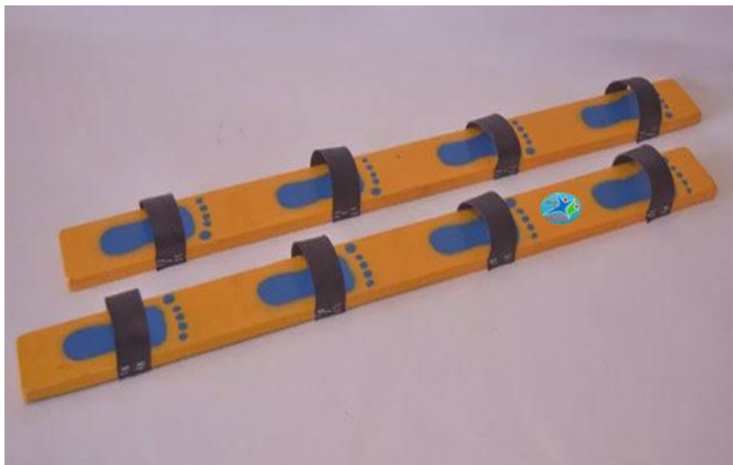
Hasil Karya orang lain