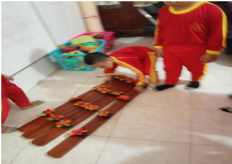
Selanjutnya seluruh permainan menggunakan bakiak raksasa Karya penulis Sendiri