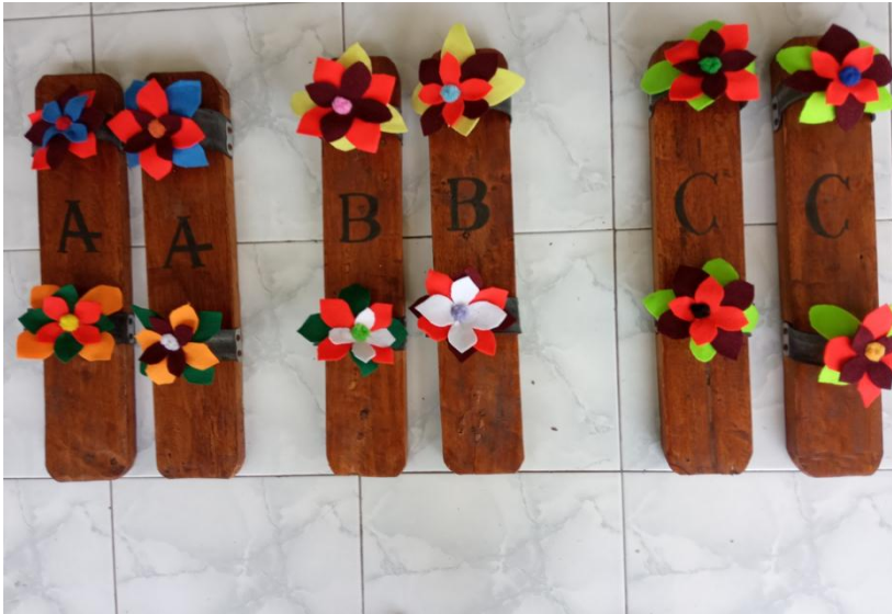
Bakiak raksasa karya penulis