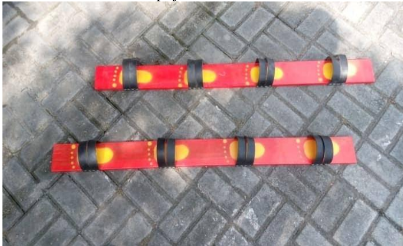
Hasil Karya orang lain