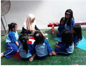
Foto diambil saat melakukan tretmen peneliti menjelaskan tentang kolase menggunakan jagung