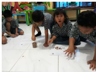
Foto diambil saat post tes anak melakukan kolase dengan kertas yang ada pola gambarnya