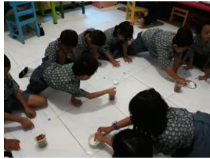
Foto di ambil saat pretes anak membuat kolase dengan kertas tanpa pola gambar