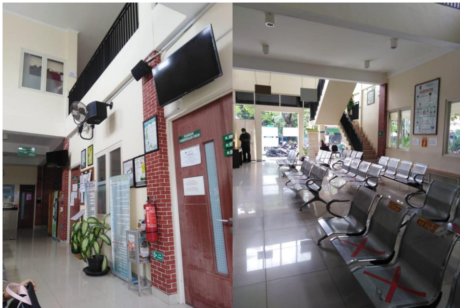
Foto Tampilan dalam Puskesmas Ngage Rejo