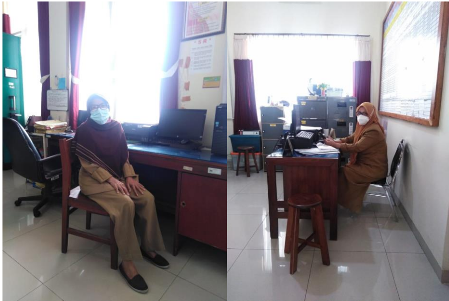
Foto Tenaga Kesehatan Yang Mengenakan Masker Saat Bekerja